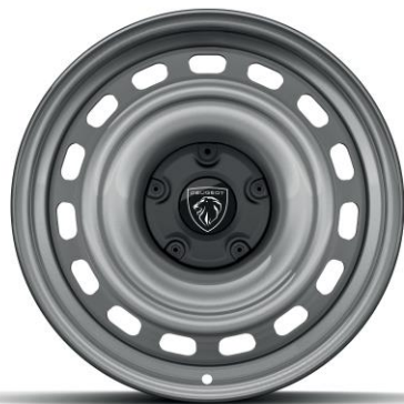
ACTIVE PACK - Serie