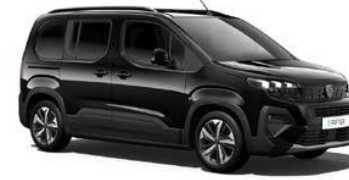
Perla Nera Schwarz