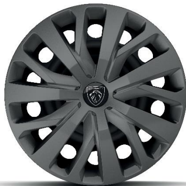
ALLURE - Serie

Stahlfelgen 16'' mit Radzierkappen TONGARIRO