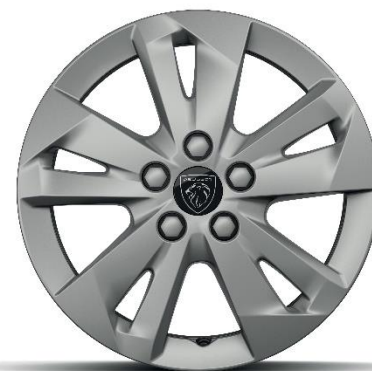
ALLURE - Option

Stahlfelgen 16'' mit Radzierkappen TONGARIRO